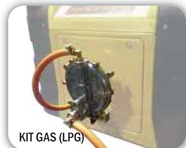
KIT GAS (LPG)